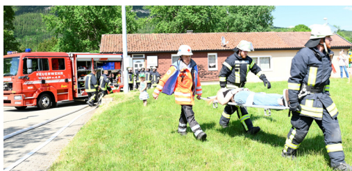
Bergung der Verletzten