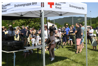
Drohnenbilder für den besseren Überblick