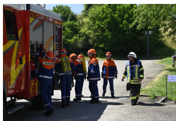
Übung der Jugendfeuerwehr Schömberg, der auch 3 Jugendliche aus Ratshausen angehören