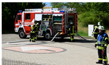
Einsatz der Feuerwehr Ratshausen

Das Szenario: Brand in der Plettenberghalle, ausgelöst durch eine Verpuffung der Pelletheizung. In der Halle eine Jugendsportgruppe, die unter starker Rauchentwicklung gerettet werden muss.