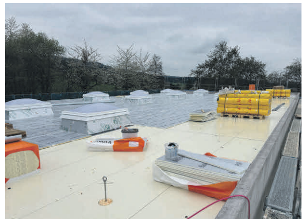
Flachdachaufbau mit Platten und Dämmung. Derzeit wird die Folie aufgebracht.