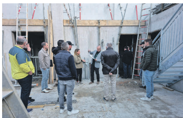
Die Mitglieder des Gemeinderats und der Feuerwehr bei einem Abstimmungstermin Anfang März auf der Baustelle.