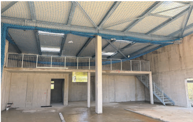
Das Bild zeigt die Fahrzeughalle und die Werkstatt des Bauhofs mit dem Lager im Obergeschoss. Das Gelände kann zum Be- und Entladen der Fläche zur Seite geschoben werden.

In loser Folge wollen wir Sie mit aktuellen Fotos über den Baufortschritt auf Allmend informieren: