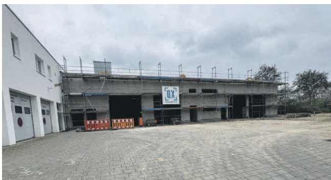
Außenansicht: Anbau an das bestehende Gebäude. Linker Gebäudeteil Feuerwehr, rechter Gebäudeteil Bauhof.