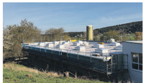
Blick auf das rückwärtige Gebäude mit dem neuen Dach und den Lichtkuppeln.