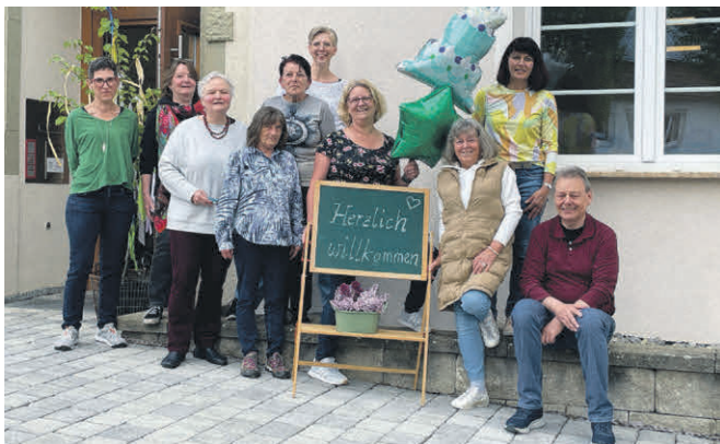
Unser Bild zeigt einen Teil der Mitarbeitenden