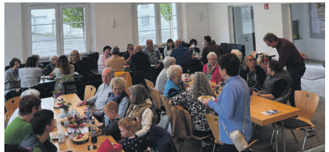
Einblick ins Rathaus-Café