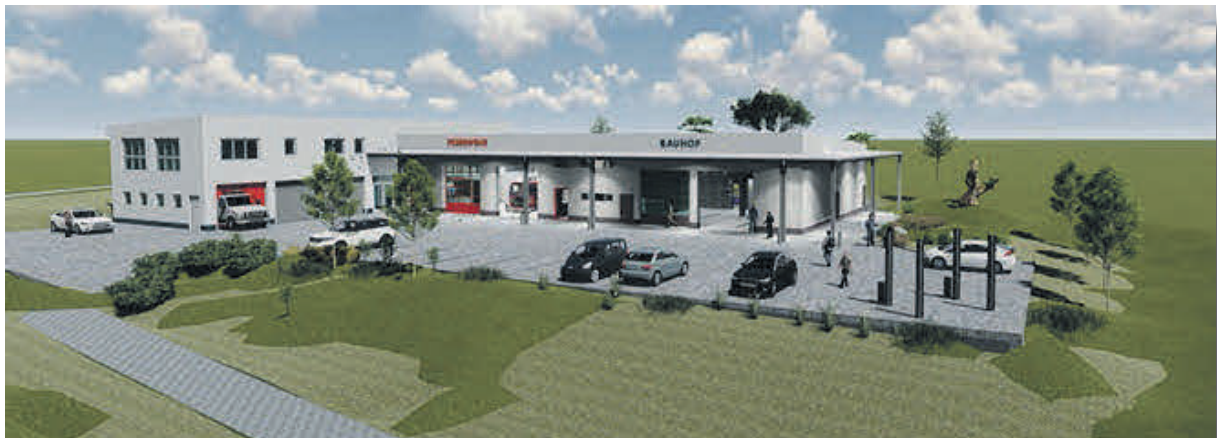
Allmendzentrum nach Fertigstellung