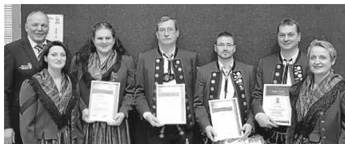
Die Geehrten des MVR